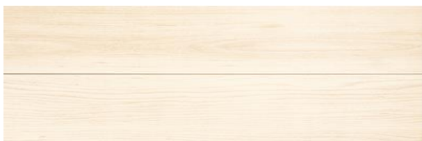
TD I-W (ホワイト)