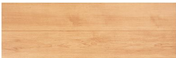
TD I-B (ベージュ)