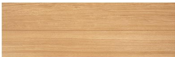
TD I-R (オータムリーフ)