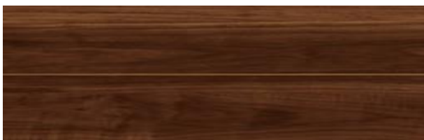
TD I-D (ダークブラウン)

※写真は印刷のため実物の色や材質感とは異なる場合があります。実物サンプル等でお確かめ下さい。