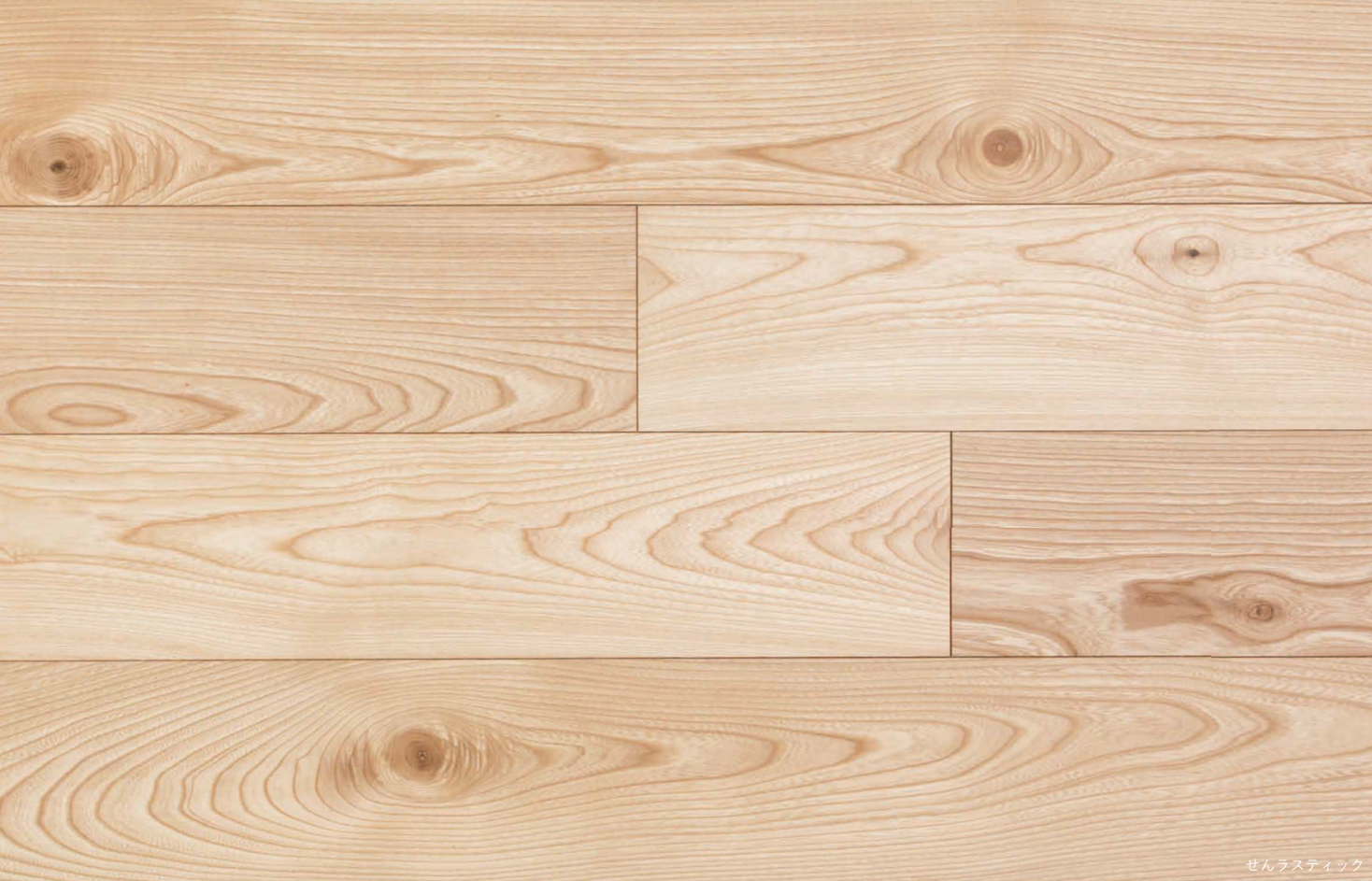
せんラスティック