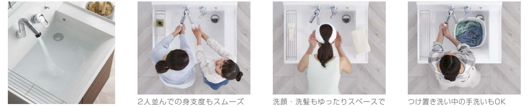
2人並んでの身支度もスムーズ 洗顔・洗髪もゆったりスペースで つけ置き洗い中の手洗いもOK

吐水口が左右に180°回転するので、ボウルを広く有効に使えます。 [ひろびろボウル&くるくる水栓]ひろびろボウル & くるくる水栓