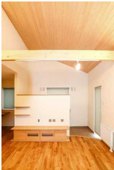
PHC-10 施工：株式会社キクザワ