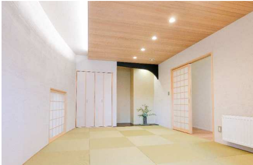
PHC-10 施工：株式会社中村建設